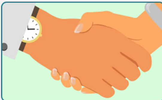
Contato Próximo, como toque ou aperto de mão com pessoa infectada (Caso suspeito ou confirmado)