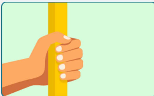
Contato com objeto ou superfícies contaminadas (Seguindo de contato com boca, nariz ou olhos)